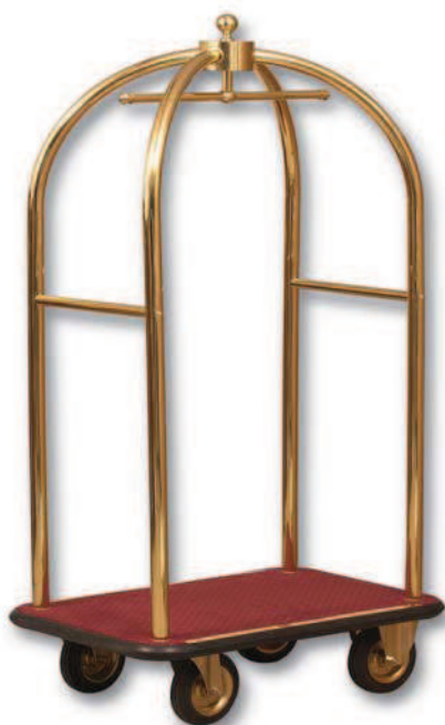
■ TESEO 800 VIP TESEO 1000 VIP

Amplia gama de carros porta trajes y maletas. Base con moqueta azul, rojo o, sobre pedido, en plástico (G).