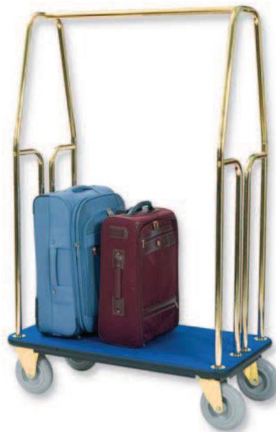
■ TESEO 800 OT TESEO 1000 OT