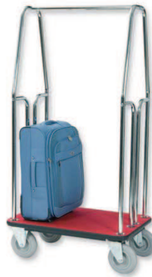
■ TESEO 800 CR TESEO 1000 CR