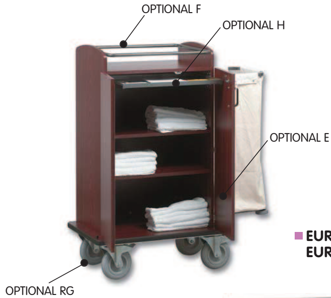
■ EUROPA 700 LE/1 EUROPA 900 LE/1