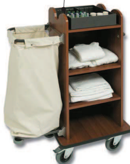
■ EUROPA 500 LE/1