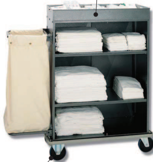
■ EUROPA 700 LA/1 EUROPA 900 LA/1