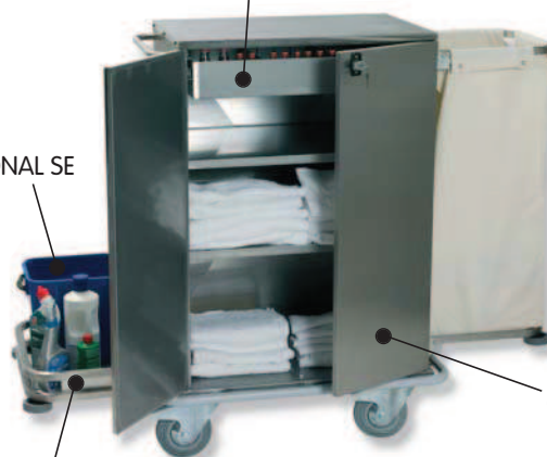
■ EUROPA 700 IN/1 EUROPA 900 IN/1