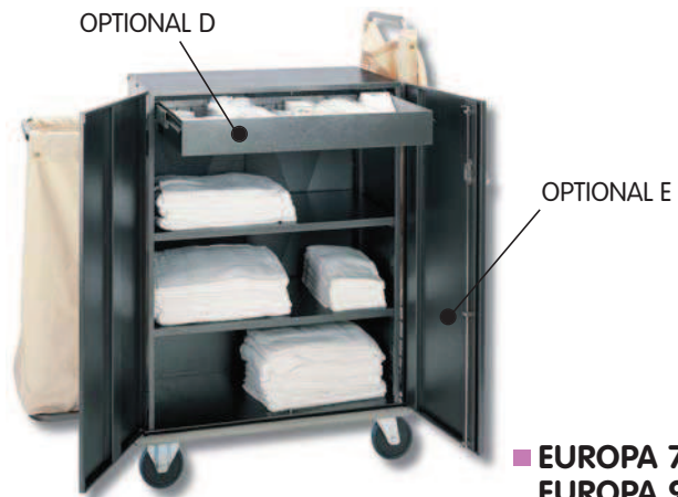
■ EUROPA 700 LA/2 EUROPA 900 LA/2