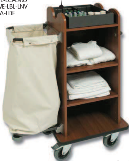
■ EUROPA 500 LE/1

LNO-LFA-LRA LPE-LCI-LMO LWE-LBL-LNV LVA-LDE