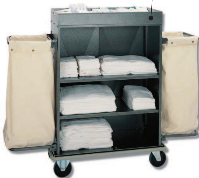
■ EUROPA 700 LA/2 EUROPA 900 LA/2