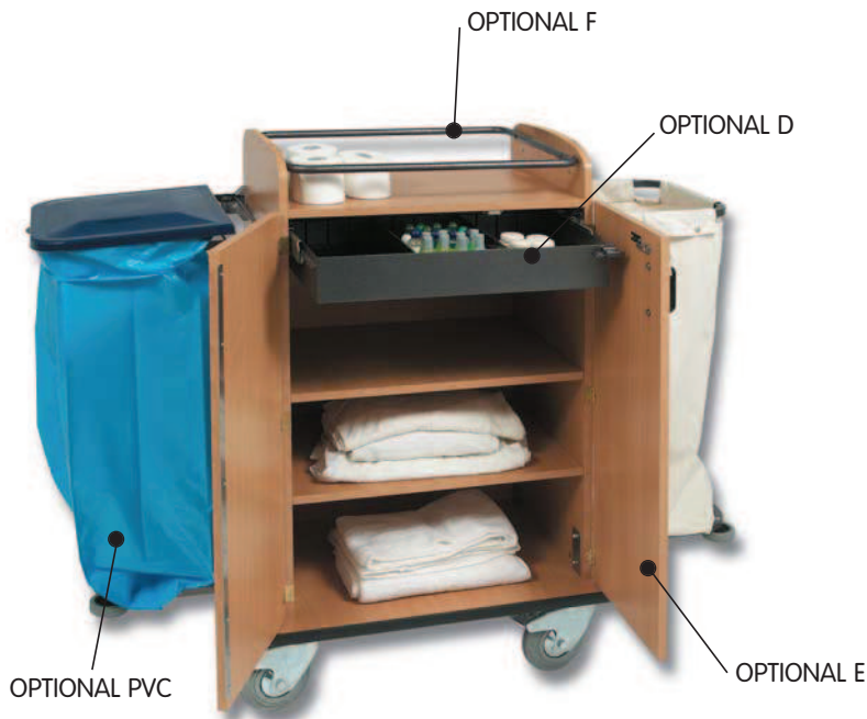
■ EUROPA 700 LE/1 EUROPA 900 LE/1