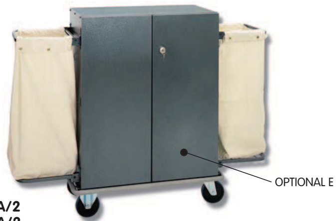
■ EUROPA 700 LA/2 EUROPA 900 LA/2