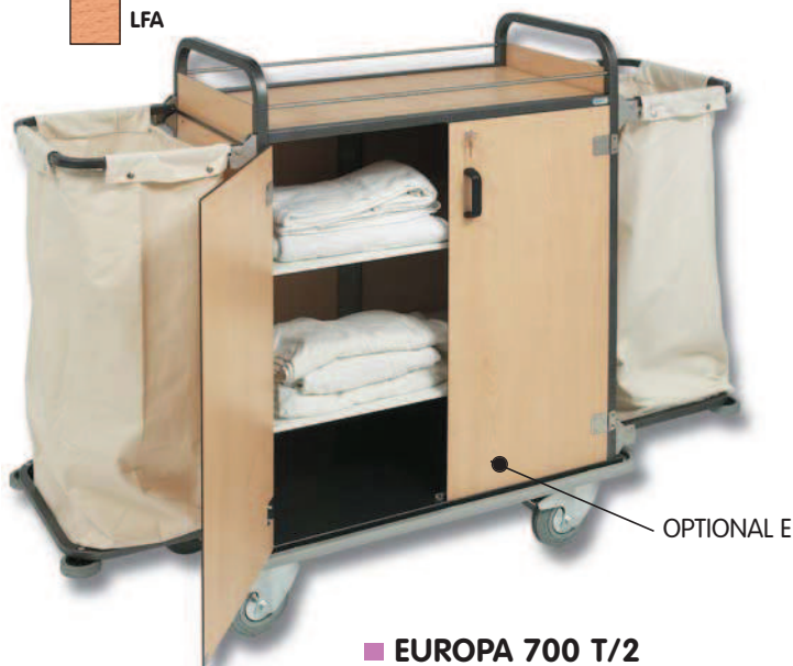
■ EUROPA 700 T/2 EUROPA 900 T/2